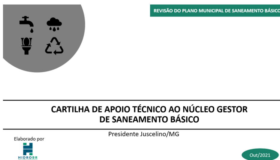
Figura 5.2 - Ilustração da capa da cartilha elaborada para o Núcleo Gestor de saneamento básico

interdisciplinares que demandam diferentes divisões dentro da organização de uma gestão pública, torna-se adequado a criação de uma unidade articulada entre os diversos membros responsáveis no município pelas ações de gestão relacionadas ao saneamento básico. Diante disso, a Cartilha elaborada apresenta à atual gestão do município a importância, a função, sugestão de integrantes, a forma de organização do NG e da gestão das informações de saneamento. Ademais, foram exemplificados neste instrumento sugestões de pautas possíveis a serem trabalhadas entre os integrantes do NG.