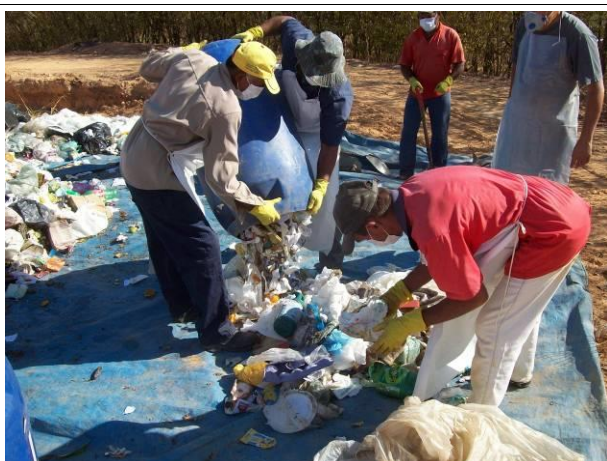
Foto 3: Descarregamento da amostra para determinação da composição gravimétrica