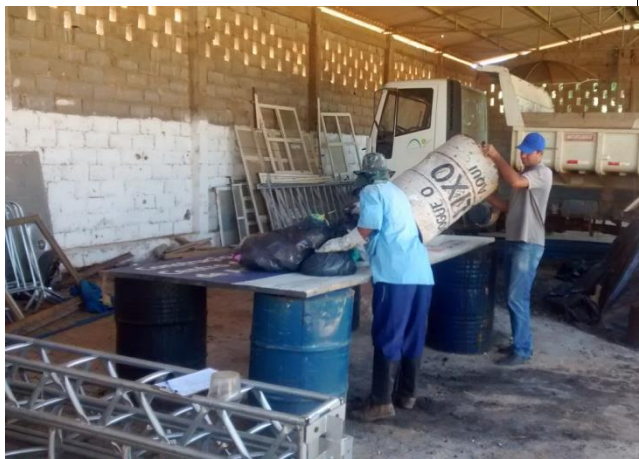
Foto 3: Descarregamento da amostra para determinação da composição gravimétrica