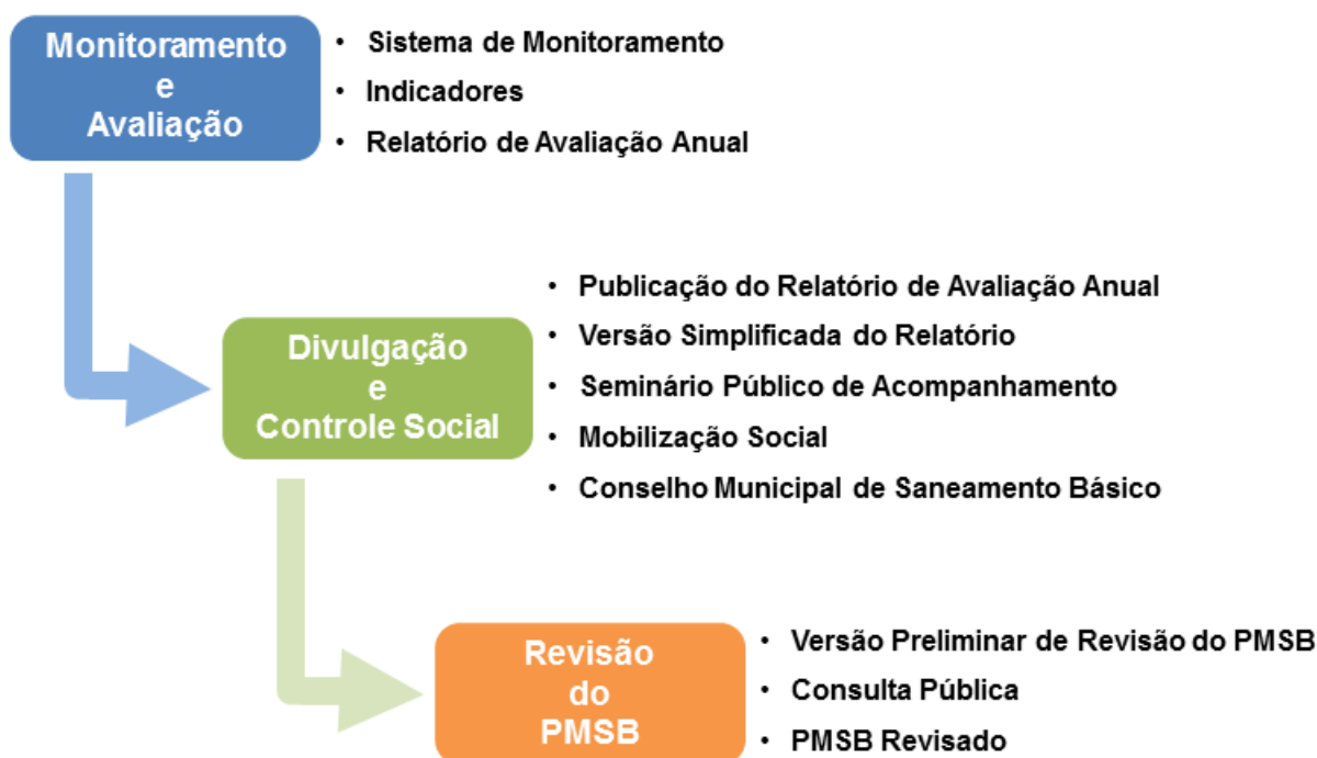
Figura 6.1 – Fluxograma da metodologia adotada

A Figura 6.1 ilustra as etapas e respectivos mecanismos estabelecidos neste documento.